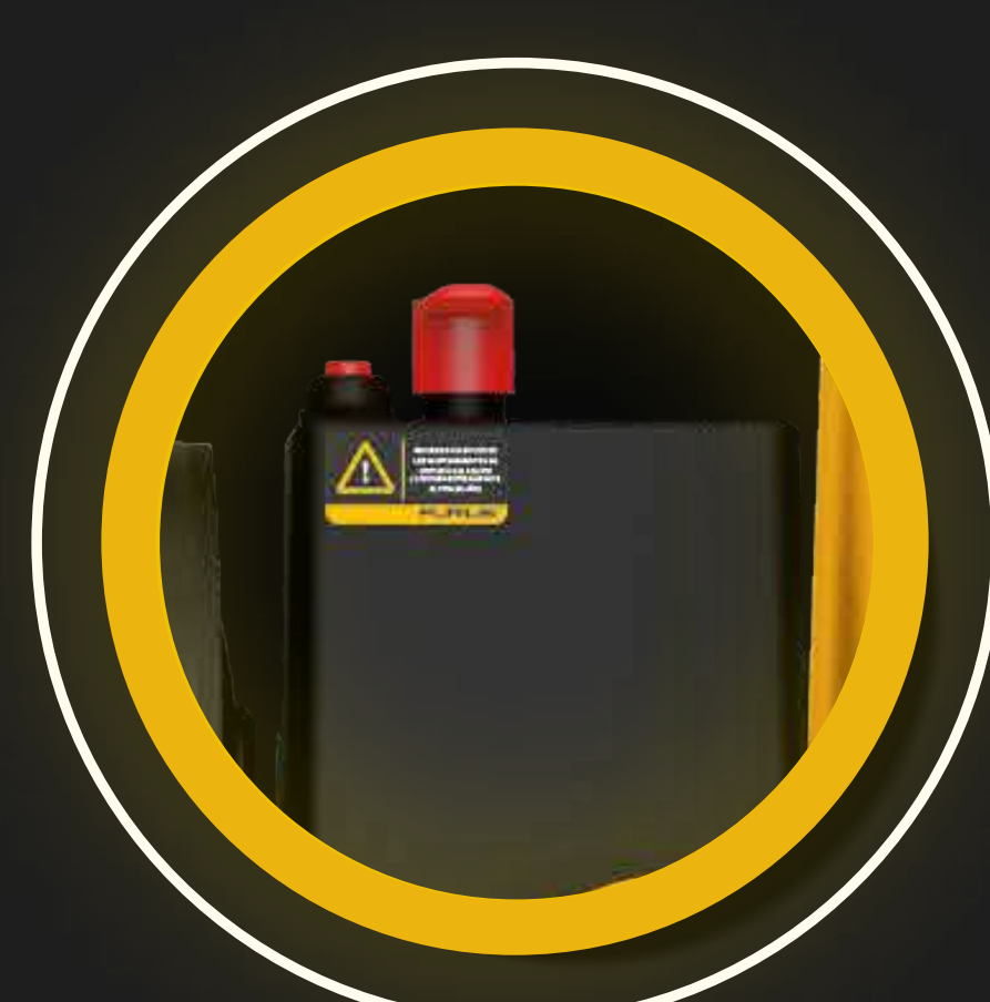
INTERRUPTOR DE PRESIÓN