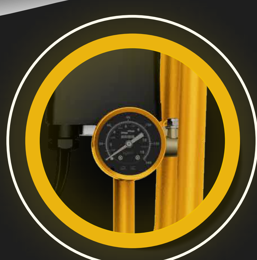
MEDIDOR DE PRESIÓN